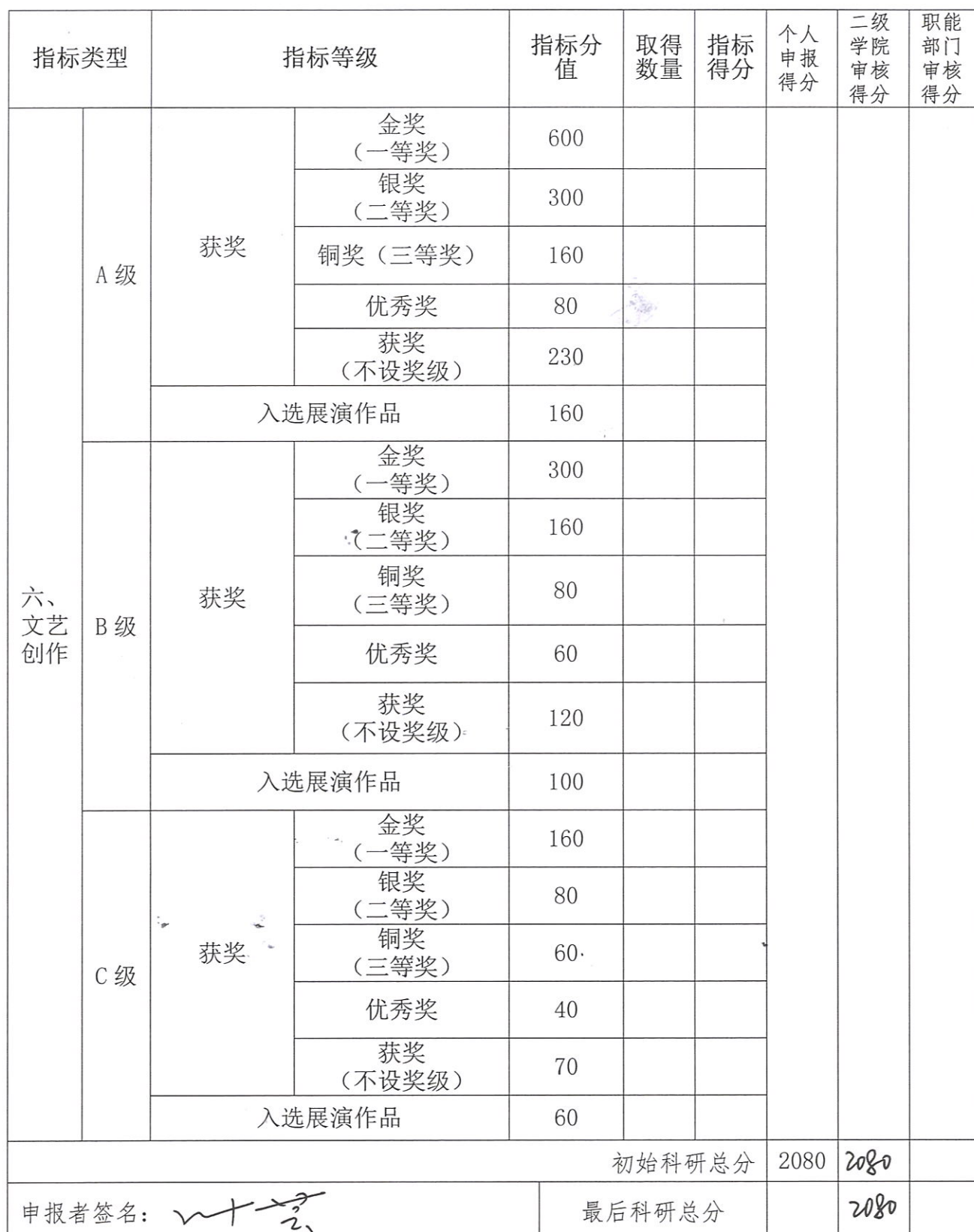
任现职以来科研创新能力评价计分汇总表 2-2 (社会科学类)

注:当【学术论文分值】超过【初始科研总分】的 60%时,需将此项分值按【初始科研总分】的 60%计入个人【最后科研总分】(只折算一次)。